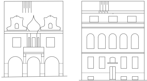
FAS. PŘEDNÍ /SEVER/ FAS. ZADNÍ /JIH/